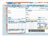
标签的格式为2009年10月的格式。