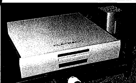
●Ricky現在玩CAS為主，不過他認為CD機都是系統中不可或缺的器材。