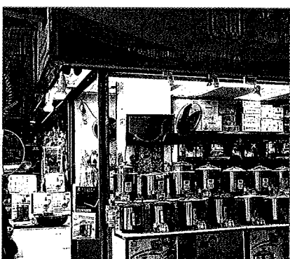
荃灣漢豐唱片前址