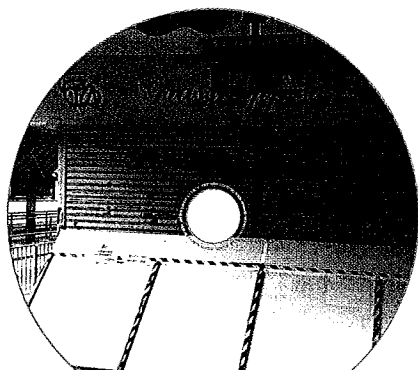
觀塘保聲唱片前址