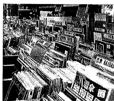
舊式唱片舖的土炮name tag，這裏的像森林一樣密，將來可能成為集體回憶。